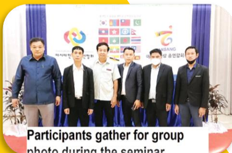
Participants gather for group photo during the seminar.