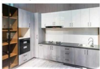
บริษัทผลิตเฟอร์นิเจอร์ Covered Bridge Cabinetry Manufacturing Co., Ltd.